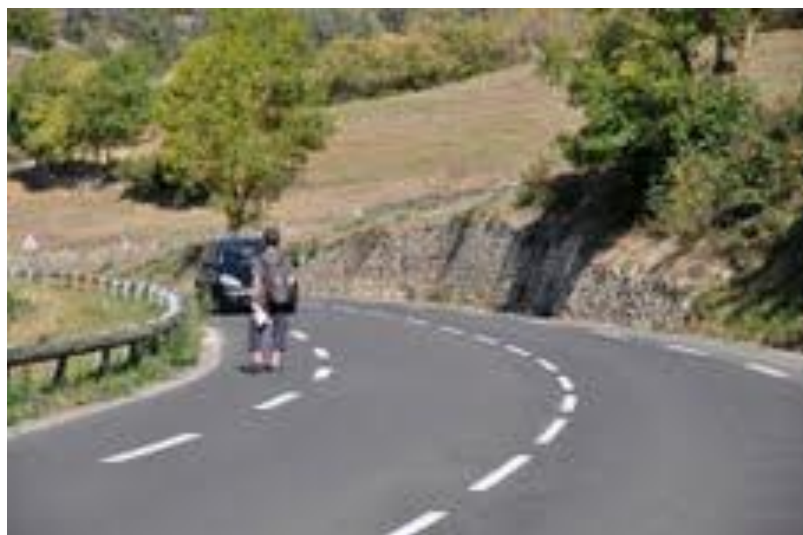
Photo réalisée sans trucage et se passant de commentaire. Entre Marvejols et Montrodat

Repérages réalisés entre Septembre et Novembre 2011.