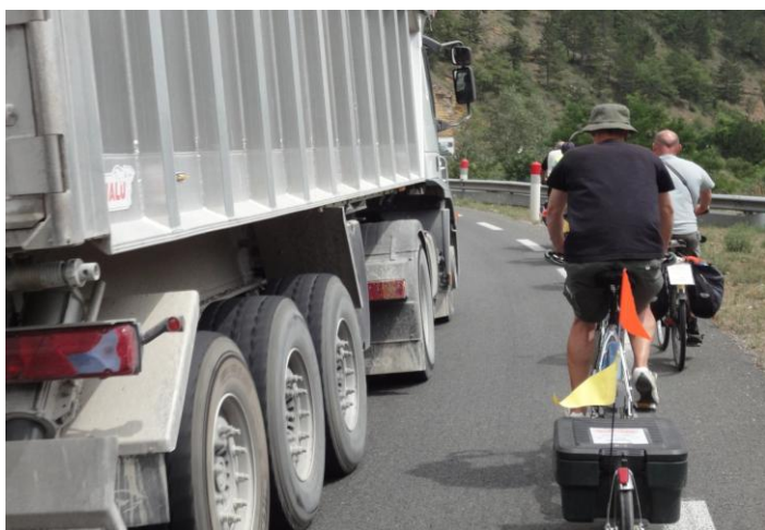
Rando Vallée du Lot - Juillet 2011- le calme et la sécurité des routes de Lozère