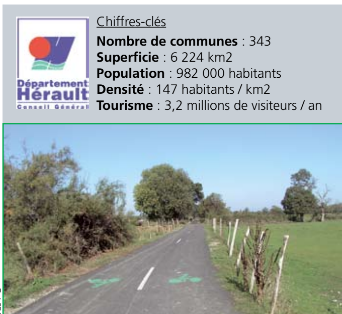
Piste cyclable Lattes - Palavas. Cet aménagement de près de 6 km réalisé par le département sur une ancienne VFL s'inscrit dans l'axe littoral - liaison Montpellier à la Mer du schéma départemental.

Les 18 et 19 septembre 2008, le Conseil général de l'Hérault sera l'hôte des 12èmes Rencontres des départements cyclables. L'occasion de faire un point sur la politique vélo d'un département ambitieux.