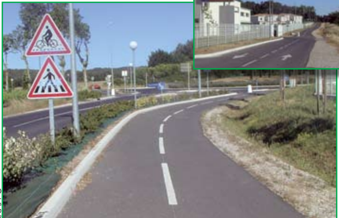
Piste cyclable liaison collège de Jacou de 2 km réalisé par le département et s'inscrivant dans l'axe "sécurisation des accès collèges".