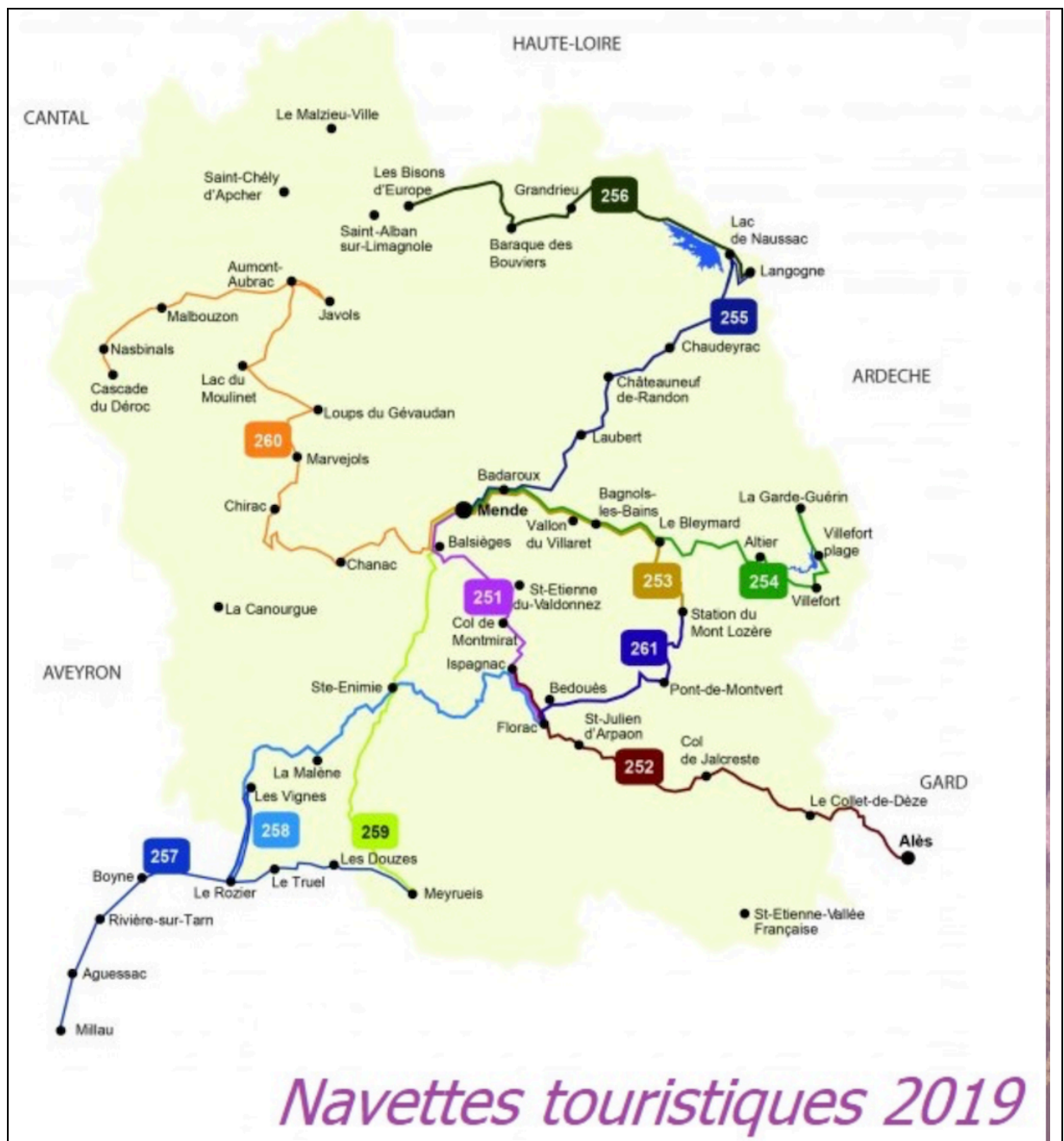
Carte des « Navettes touristiques » en Lozère en 2019