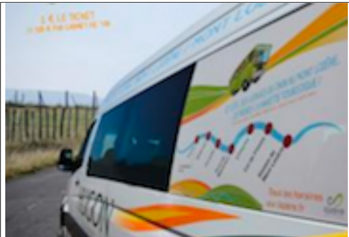
Une navette touristique en Lozère (mini-bus Hugon)