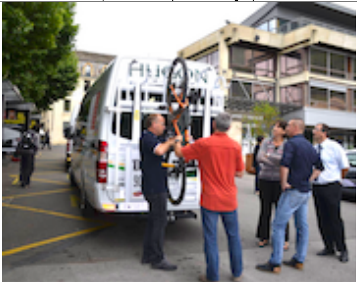
Navette touristique en Lozère, avec rack à l'arrière pour 5 vélos