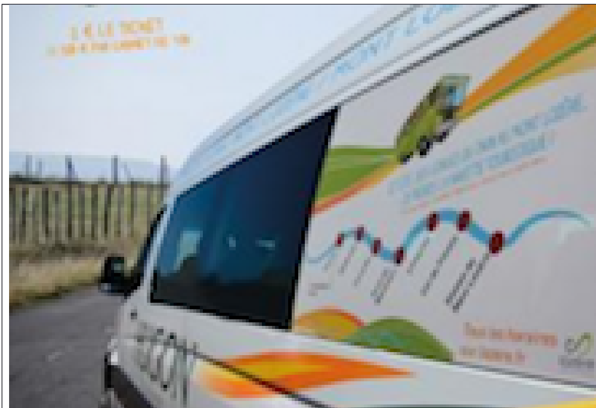
Une navette touristique en Lozère (mini-bus Hugon)