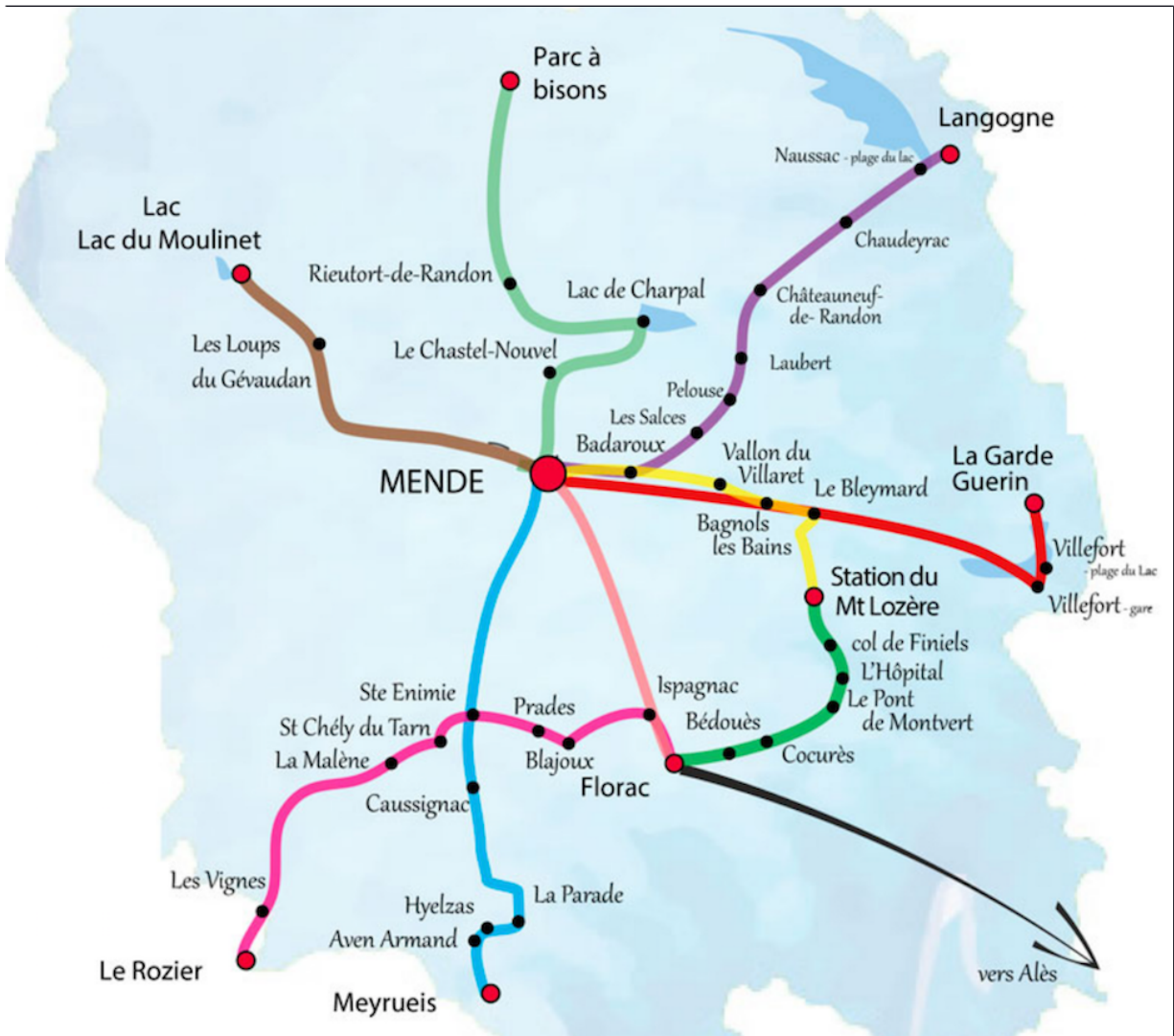
Carte des « Navettes touristiques » en Lozère en 2017